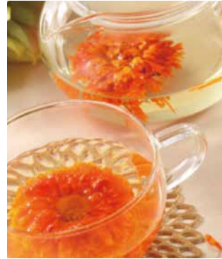
淡路廣田農園の有機カレンデュラ