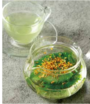
大葉&キンモクセイ