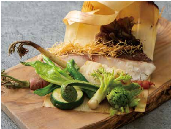
発酵鮮魚と旬菜 杉板焼き