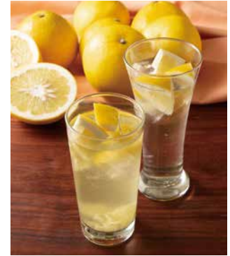
本日の柑橘スカッシュ