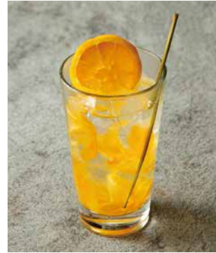
ハーブ香る人参エール